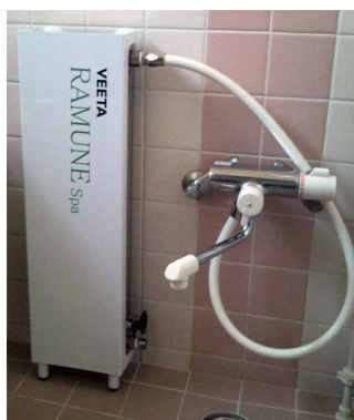
ご家庭用炭酸泉装置