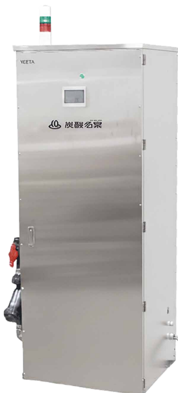
業務用炭酸泉装置