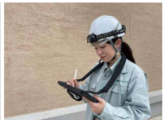
建設DXにも取り組み、働き方改革を促進しています。