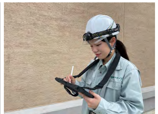
建設DXにも取り組み、働き方改革を促進しています。