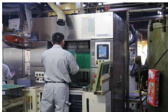
半田レベラー作業