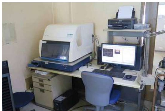
蛍光X線装置による評価分析