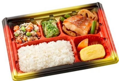
まごころ小箱 630円(平日のみ)