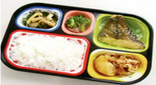
ふれ愛小町(大) 540円(なし) ※日曜日は630円(なし)