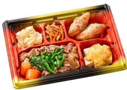
まごころおかず 740円(土・祝あり)