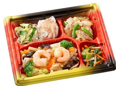
まごころ手鞠 600円(平日のみ)