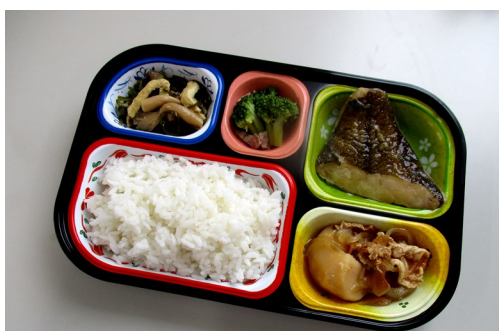
まごころ小町(大) 550円(なし)