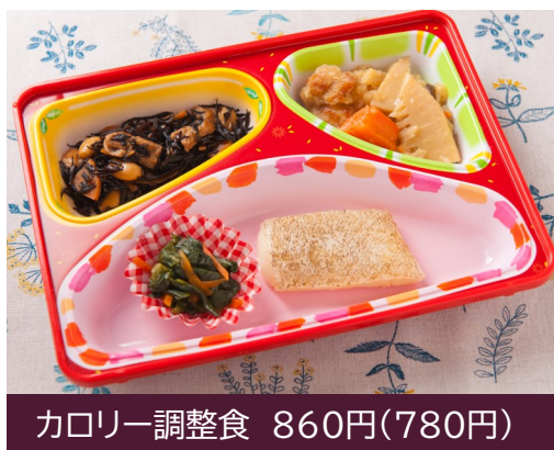
カロリー調整食 860円(780円)