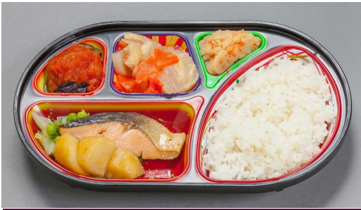
たんぱく調整食 840円(780円) ※日曜日は950円(880円)