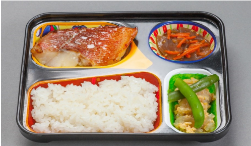
ふれ愛小町(小) 490円(なし) ※日曜日は550円(なし)