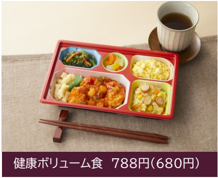
健康ボリューム食 788円(680円)