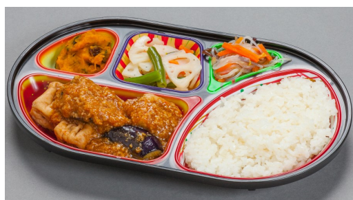
糖質カロリー調整食 850円(750円)