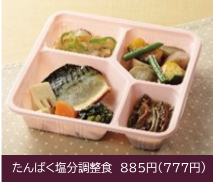
たんぱく・塩分調整食 885円(777円)