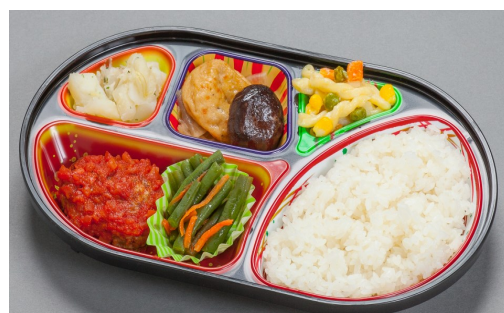
たんぱく調整食 920円(810円)