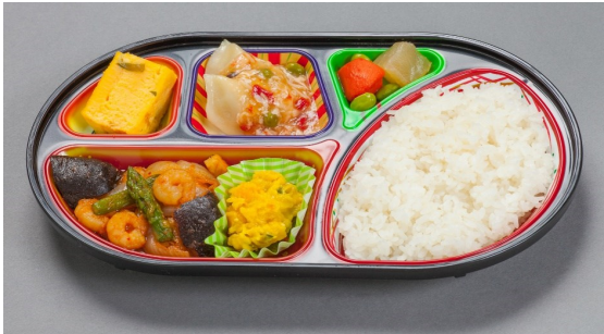
普通食 590円(520円) ※日曜日は690円(630円)