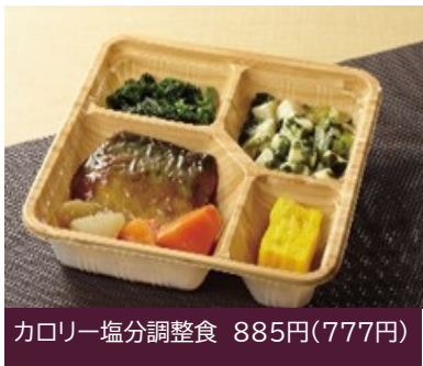
カロリー・塩分調整食 885円(777円)