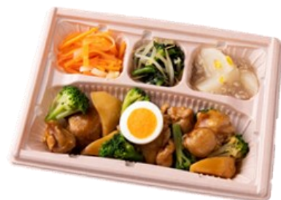
ワタミdeおいしい健康 730円(平日のみ)