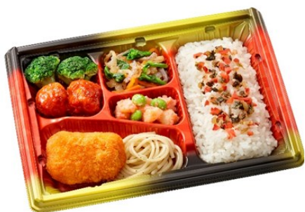
まごころ御膳 730円(土・祝あり)