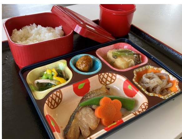
カロリー調整食 800円(800円)