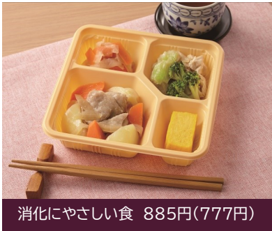
消化にやさしい食 885円(777円)