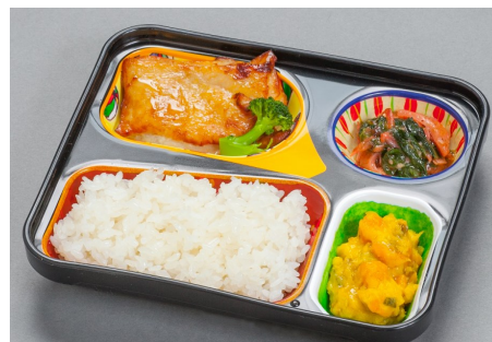
まごころ小町(小) 500円(なし)