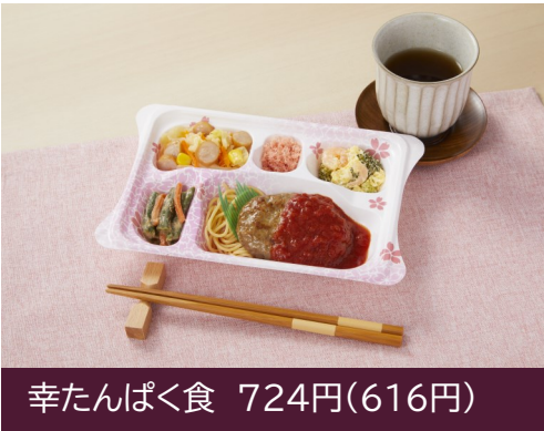
幸たんぱく食 724円(616円)