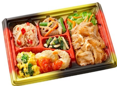
まごころダブル 820円(平日のみ)