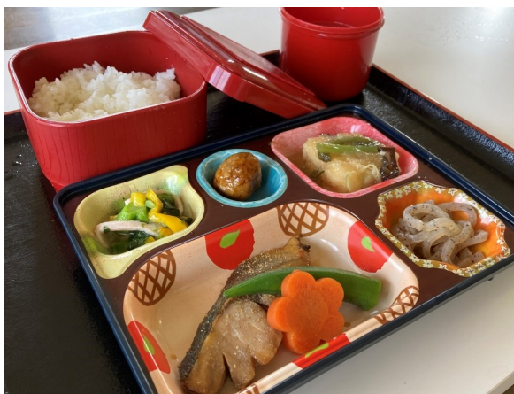
カロリー調整食 800円(800円)