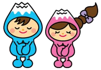
富士見市マスコットキャラクター 「ふわっぴー」