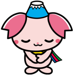
ふじみ野市PR大使 『ふじみん』