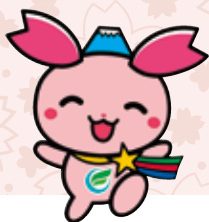
ふじみ野市PR大使「ふじみん」

子どもと子育て家庭のための新しい計画ができたよ！ どんな計画なのかふじみんと一緒に見ていこう！