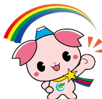
ふじみ野市けんこう大使「ふじみん」

店舗の都合で、休業やメニューの提供を中止している場合があります。ご了承ください。