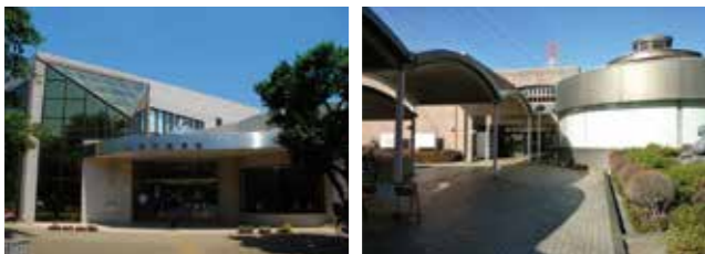
図 大井図書館 (TEL263-1100)