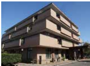
図 高齢福祉課 (TEL262-9038)