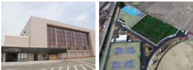
図 スポーツセンター▶文化・スポーツ振興課 (TEL220-2090) 運動公園およびサッカー場▶公園緑地課 (TEL220-2067)