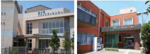
図 協働推進課 (TEL262-8123)