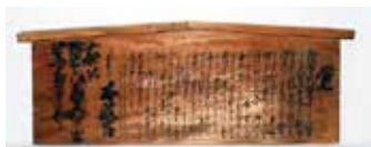
◀明治維新後、新政府が各地に出した高札(市指定文化財)