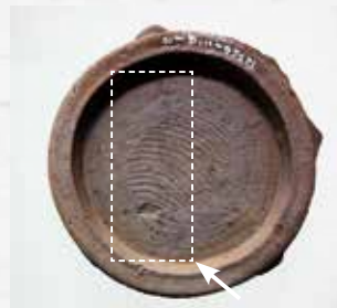
福岡新田遺跡出土墨書土器(円の中央部に文字が書かれている)