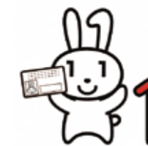
マイナンバー PR キャラクター「マイナちゃん」