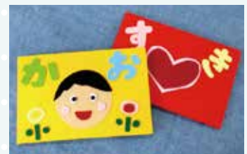
※画像は制作中の動画のイメージです。