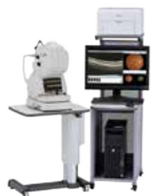
▲眼底三次元画像解析装置

受診方法 受診券(はがき)が届いたら、直接、実施医療機関(左表)に予約して受診する