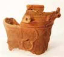
▲西ノ原遺跡 第173地点の縄文土器

一方、中期の土器になると、前期のように縄文を全体に付けることは少なくなり、平成29年度調査の西ノ原遺跡第173地点で見つかった縄文時代中期の住居跡からは、勝坂式(かたさか)と呼ばれる中期中頃の土器が出土しました。この土器は、粘土紐を貼り付けて立体的に表現したり、縄以外の道具を使ってさまざまな文様を付けたりする特徴を持っています。土器の厚さも、前期のものに比べて厚手です。どちらも縄文時代に作られた土器ですが、時期によって違った印象を受けるのではないのでしょうか。8月29日(土)からは、上福岡歴史民俗資料館に巡回します。縄文の匠の技をぜひご覧ください。