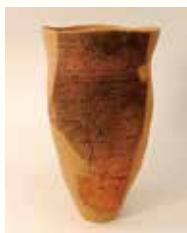
▲長宮遺跡 第54地点の縄文土器

前期の土器の特徴は「縄文」にあります。平成29年度に調査した長宮遺跡第54地点では、縄文時代前期の住居跡が軒見(せきやま)つかりました。一緒に見つかった土器は、関山式(せきやま)という前期前半の特徴を持つものです。この土器の表面をよく見ると、