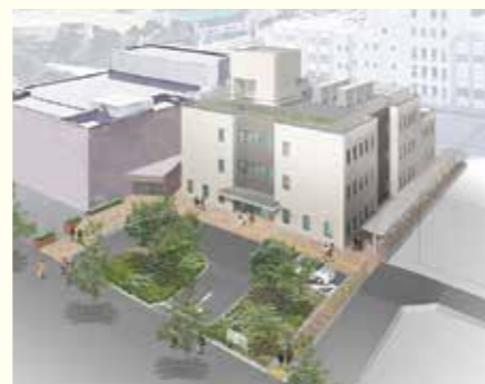
▲ふじみ野ステラ・イースト