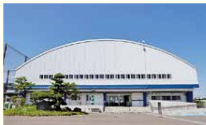
▲ふじみんアリーナひこぼし

市では、スポーツ施設においても「おりひめ」、「ひこぼし」という名称がつけられています。文化施設とスポーツ施設が一体となり、市民の皆さまの「心」と「体」の健康を支えてまいります。