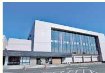
▲ふじみんアリーナおりひめ