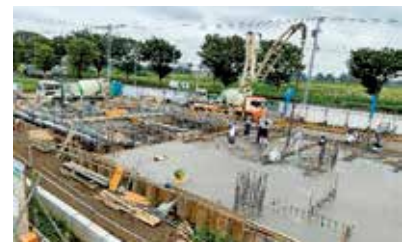
▲進捗状況(令和2年9月中旬現在) 庁舎棟スラブコンクリート打設工事

当組合では、来年3月の開署を目指し、ことし4月から富士見市水子4060・1に東消防署富士見分署の庁舎移転整備に伴う建設工事を進めています。工事期間中は、建設車両の通行や騒音によりご迷惑をおかけしますが、ご理解とご協力をお願いします。