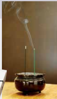
▲無 ZERO (左)と一般的なお線香 (右)。どちらも燃えた状態。

埼玉武州葬祭は、ふじみ野市や川越市を中心に葬儀をとり行う葬儀会社です。「葬儀の費用を抑えつつ、安心して故人を送っていただく。遺族の気持ちに寄り添いながら、尊厳を持って故人を送っていただく。それが埼玉武州葬祭の考えるお葬式です。お葬式のことは私たちに相談ください」今月は、埼玉武州葬祭から、煙も香りもほとんど無いお線香「無 ZERO」(1,300円相当)を、抽選で23名にプレゼントします。