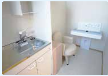
▲授乳スペース・おむつ替えシート

ステラは、イタリア語で星という意味で、市民一人一人が星のように輝き、主役になれるようにという願いが込められています。「さまざまなイベントや講座が開催されて、気軽に文化活動にチャレンジでき、たくさんの方が楽しめる、ステラの名前のとおりそんな輝くスポットになってほしい」と思い