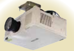
▲天井に設置したプロジェクター(多目的ルームA・ミーティングルームA)