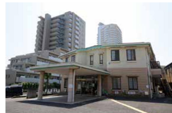
▲介護予防センター(霞ヶ丘1・5・1)

ールや骨盤の安定、姿勢の改善に係っています。姿勢と呼吸を意識しながら日常生活動作に直結するような骨盤底筋の使い方を学びましょう。 日時 9月13日(月)午後1時30分～2時30分、9月15日(水)・16日(木)午前10時30分～11時30分 ※3日間とも内容は同じ。 場所 介護予防センター1階 持ち物 介護予防センター利用登録証、マスク、飲み物、タオル 対象 65歳以上 定員 各30人(申込順) 申込方法 9月6日(月)から窓口か電話で申し込み