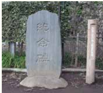
▶ 記念碑 (福岡中央公園内)

12月5日(日)まで市内各資料館で開催する特別展「資本主義の世界を拓くくふじみ野の経済人たちと渋沢栄一のあゆみ」では、明治から大正にかけて活動した、星野仙蔵や神木一族などくふじみ野の経済人たちと、彼らが日本の近代化に与えた影響について紹介します。