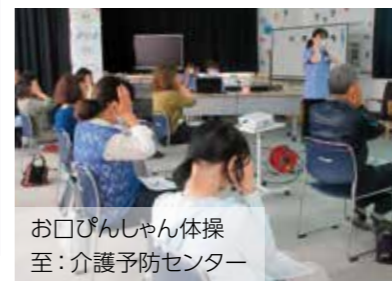
お口ぴんしゃん体操 至：介護予防センター

場所 大井総合福祉センター1階 ふじみんぴんしゃんホール 内容 歯科衛生士と管理栄養士による講話(お口の機能チェック、ふじみんぴんしゃん体操、食事の量とバランスなど)