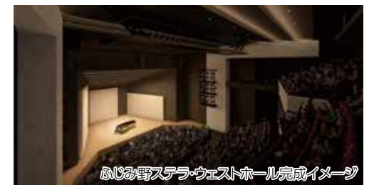
ふじみ野ステラ・ウェストホール完成イメージ