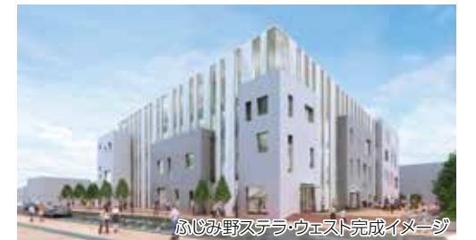
ふじみ野ステラ・ウェスト完成イメージ