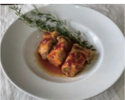
▲ポークで巻いたさつまいもとりんごのトマト煮