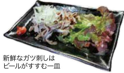
新鮮なガツ刺しは ビールがすすむ一皿