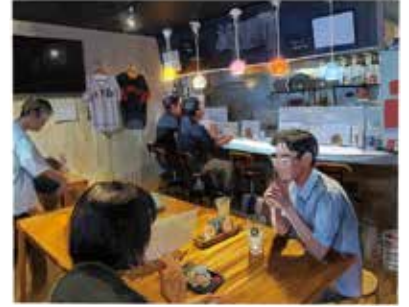
カジュアルで心地よい内装。客席は カウンター、テーブル、小上がりも