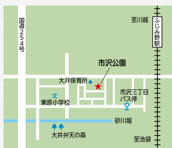
図 上福岡歴史民俗資料館 (TEL049・261・6065)