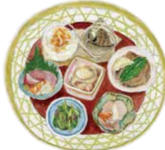
7種のおつまみが彩る晩酌 セットは目でも楽しめる逸品