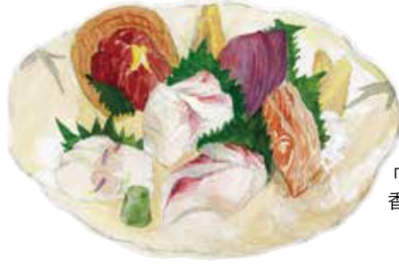
冷凍ものを使わないお刺身 ならではの食感がぜいたく