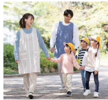
子どものその 幼保連携型認定こども園 TEL 049・266・3332

●出前保育(申込不要) 日時 5月22日(水)午前10時~11時 場所 東久保中央公園(カリヨン広場)(ふじみ野1・3) ※直接現地へお越しください(雨天中止) ●成長を知らそう「手型型カレンダー作り」(申込不要) 日時 6月3日(月)午前10時~11時 寺親屋 子どもと遊ぶ(申込不要) 日時 6月10日(月)午前10時~11時 ●自然学校「保育園の友だちと散歩体験」(申込不要) 日時 5月16日(水) 午前9時30分から