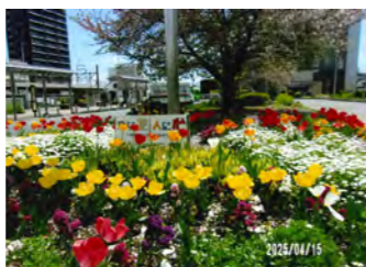
▲令和7年度最優秀賞「上福岡西口駅前の花だん(駅前のいこいの場)」(岩崎公夫さん撮影)