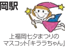
上福岡七夕まつりの マスコット「キララちゃん」