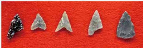
西ノ原遺跡第158地点出土の石鏃

※入間東部地区事務組合(TEL 261・6031)でも毎日24時間体制で医療機関をご案内しています。