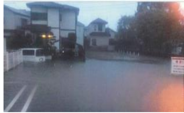
平成25年台風26号 元福岡地区(寺尾小学校付近)