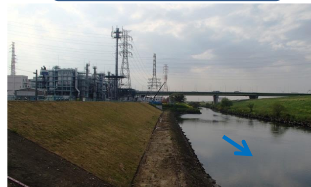
新河岸川下流工区 和光市新倉付近