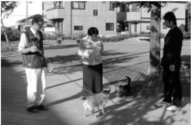
犬の散歩ができる「南台あすなろ公園」

問 安心安全のまちづくりは、市として大きなテーマだ。市民から得られる危険情報を一元的に受けとめ、トップダウンで即時に対処できるシステムを設ける考えは。また、プール事故の教訓を生かしていくため、毎年「安全総点検の日」を制定すべき。