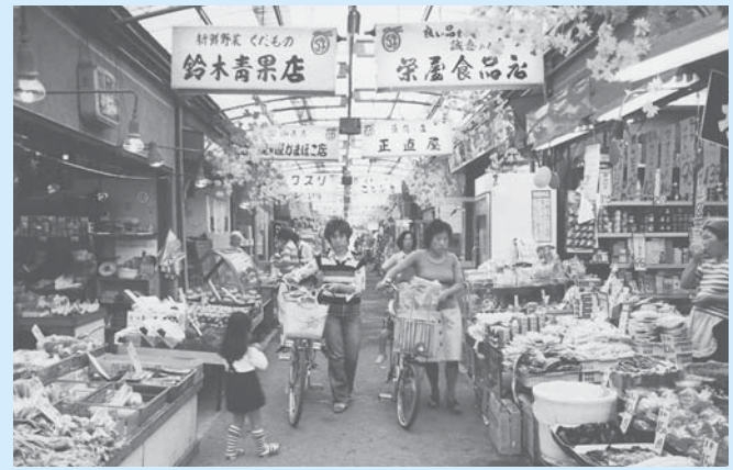
昭和40年代後半の様子