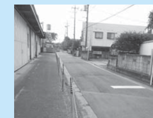
道路幅及び歩道整備予定地

答 周辺地域の市道については、平成28年度に実施する総合交通体系調査をもとに、今後、検討していきたいと考える。