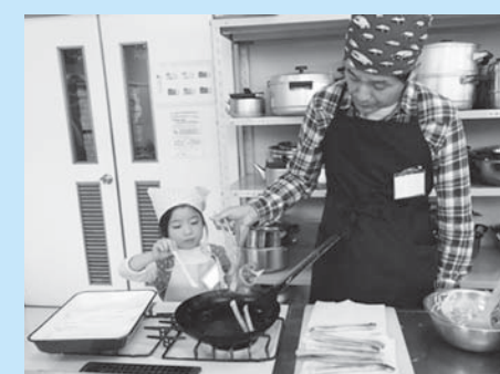
パパと子どもの料理教室

男女共同参画社会づくりの施策を計画的に進めるため、第2次計画づくりに向け、業務委託料が計上されました。