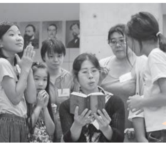
参加した子どもたち

Q 今回のオペラ教室で、楽しみにしていたことは？ A 衣装を着られること。 Q 「楽しかったー」「もっとやってみたいー」と思ったことは？ A 違う役や他の物語もやってみたい。オペラ団に入りたい。 Q 難しかったことは？ A 役になりきること。振りしながら歌うのが難しかった。 Q 感じたことや思ったことなど、自由に。 A 緊張したけど、舞台上に立って気持ち良かった。オペラは、知れば知るほど楽しくて、これから入団したい。