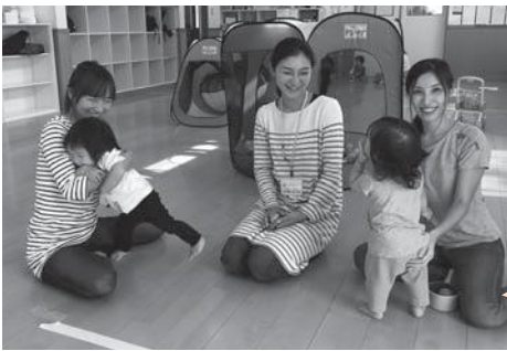
子育てサロンのスタッフさんと利用者さん

広いスペースでのびのび遊ぶことのできる場所があると助かります。親子で知り合いになることができ、双方に刺激があつて良いと思います。 自分の子どもの成長も感じることがありますね。