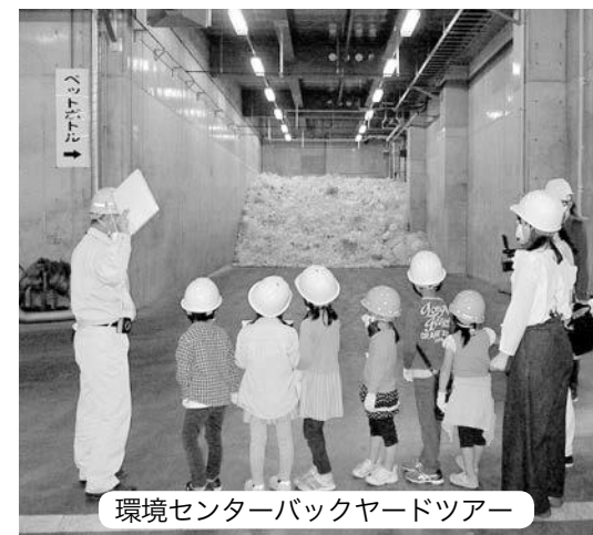
環境センターバックヤードツアー