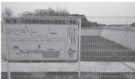
大井西中学校付近の1基目

答 対象となるのが市街化調整区域ということもあり、畑等も多く存在する。そのため流出係数も市街化区域と異なり、この面積をカバーできるものと考えている。