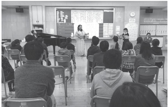
東台小学校の地域協働学校の様子