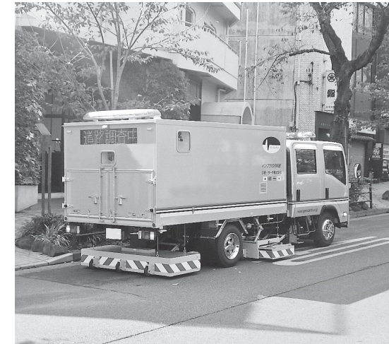
路面下空洞調査車両

答 新たに駒西、西、さぎの森、元福小学校に特別支援学級が設置される。なお、元福小学校に