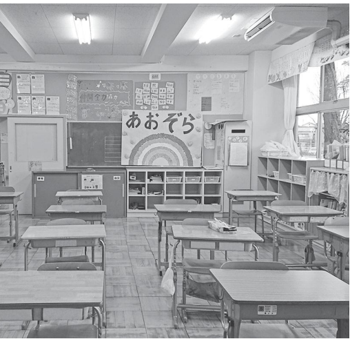
福岡中学校のあおぞら学級