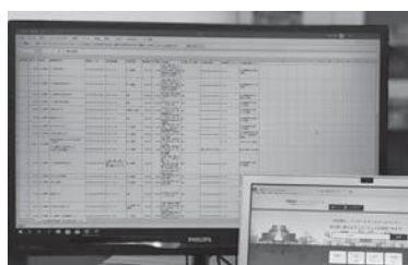
公開されている行政情報

投票へ行こう 投票率の更なる向上へ 問 投票啓発用のぼりに期日前投票所を記載しては。 答 選挙管理委員会としても、期日前投票制度の周知は必要と考える。効果が見込まれることから実施に向けて検討したい。