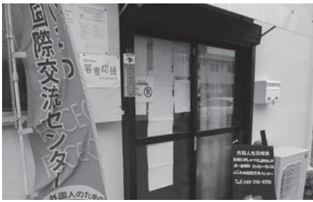
ふじみの国際交流センター

問 超高齢社会において、市民の声、特に高齢者の声が市政に届く選挙を実現するために、高齢者が歩いて行ける投票所の設置を。 答 新たな投票所を設置することに ついて、市内の全体的な投票区の見直しと併せて検討したい。