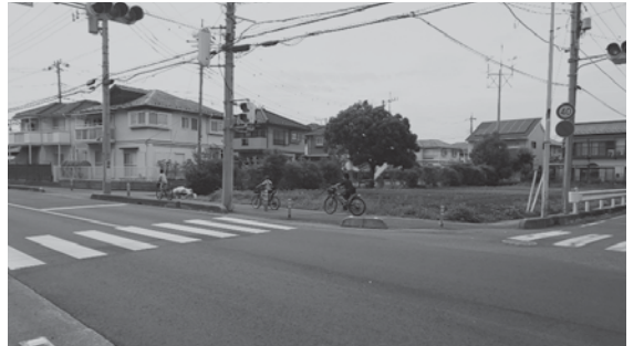
さぎの森小学校前の交差点

問 さぎの森小学校前交差点に、車両の飛び込みを防ぐ頑強なガードパイプの設置を。 答 県道部分なので、学校などからの要望があれば、県に要請する。