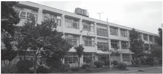
森林環境譲与税が活用される駒西小学校

消費税率の引き上げが本年10月に予定されていることや、東日本大震災を教訓として全国で実施する防災施策対応のための個人住民税の引き上げが令和5年度まで行われていること等を考慮した。