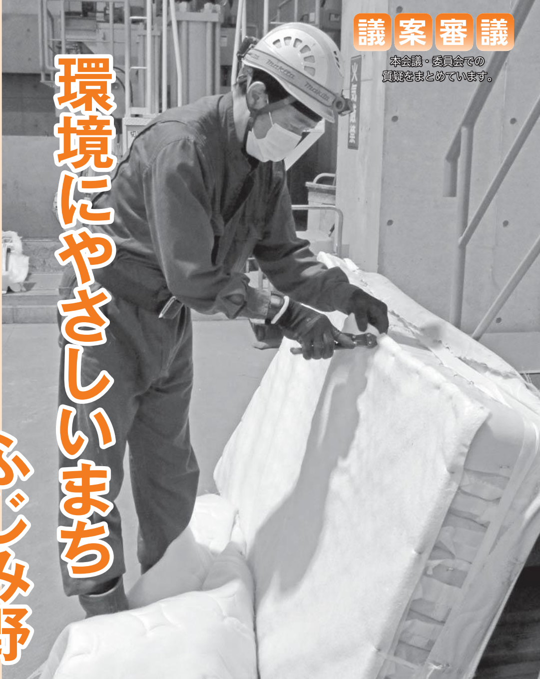
スプリング入りのマットレスを手作業で解体する作業員