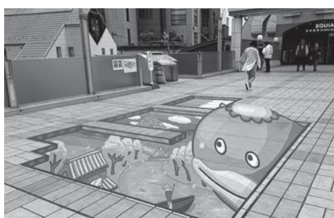
志木駅の飛び出すトリックアート

問 今年度、観光マップの内容を更新するため調整を図っている。観光マップを更新したら、案内板についてもリニューアルを実施したい。 答 上福岡駅にふじみんを活用したデザインアートを描いては。 問 画期的な取り組みであると考え。今後、市における効果的な活用方法や方向性について調査・研究し、検討したい。