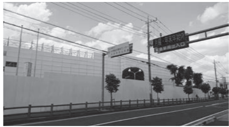
(仮称) 西地域文化施設建設予定地

西地域の新たな文化拠点整備工事の仮囲いを活かして壁画アート等を設置しては、敷地の南側に完成予想図を設置した。今後、火災予防の掲示を計画している。提案内容を踏まえ仮囲いを活かした発信を検討する。