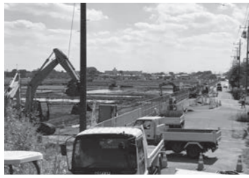
国道 254 号バイパスの工事現場