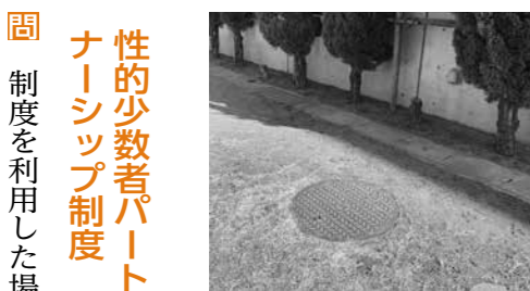
東台小のマンホールトイレ