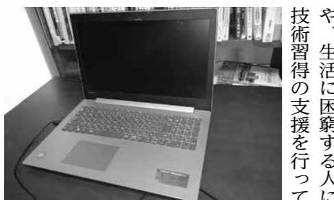
IT関連技能は収入増が期待