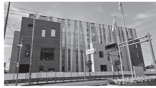
11月オープンのレストラン・ウェスト

問 自治組織のIT機能整備への支援 答 自治組織のIT機能整備に対する支援の状況は。