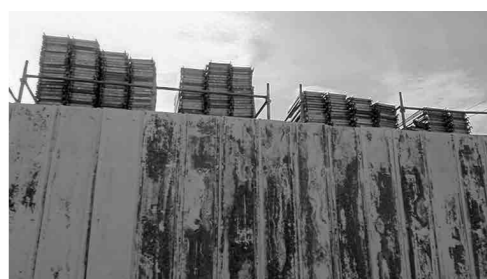
外部の目が届かない資材置き場

問 他市では敷地に鉄の板などで囲いをし、通称ヤードと呼ばれる資材置場等から騒音や悪臭、火災などが発生し問題となっている。設置規制が必要ではないか。