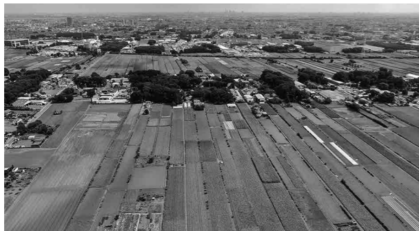
世界農業遺産に登録された落ち葉堆肥農法の武蔵野地域

答 落ち葉堆肥農法は、豊かな土壌を作り、空気や水分が含まれて、季節風による表土の飛散が抑えられる効果もある。