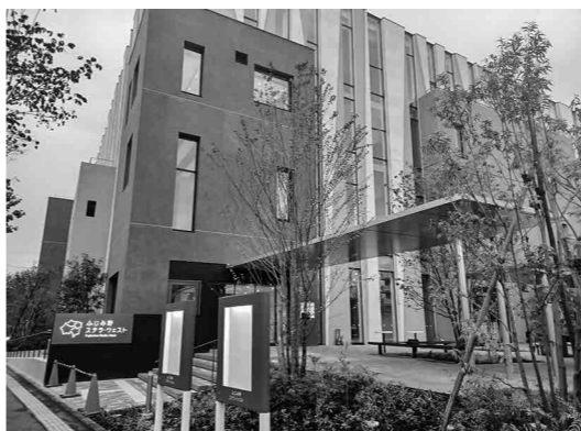
ふじみ野市に新たな文化が花開く

同時LGB TQに対して配慮しつつ、女性が女性として男性が男性として安心できる場所があることも大切であると考え