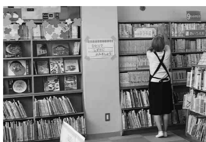
居心地の良い学校図書館