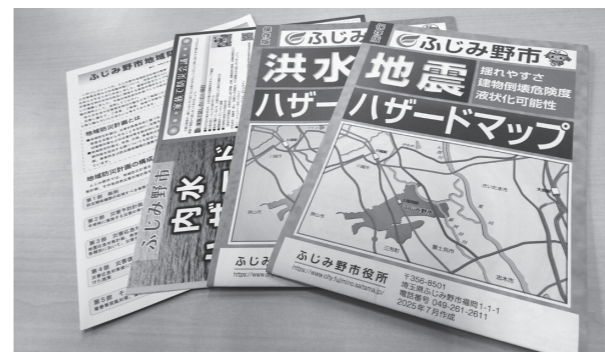
家族で話し合ってみてね

問 役立っ防災ブックを目指し作成する。現在、それぞれ記載している防災情報等の内容を一元化し、新たにペレット防災等の記事を掲載するなど、より充実し、分かりやすい内容とすることを検討している。