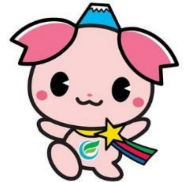
ふじみ野市PR大使「ふじみん」