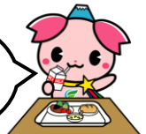
ふじみ野市PR大使 「ふじみん」

ぜひお越しください 20周年記念給食や 給食センターについてなど 日頃知る事のできない 情報が満載です！