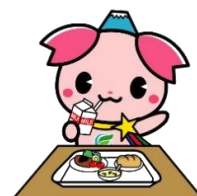
ふじ野市PR大使『ふじみん』