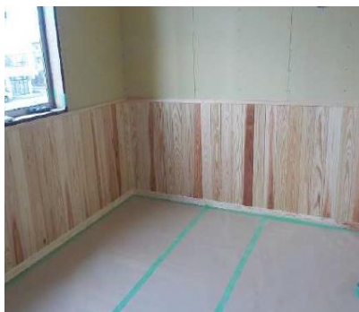
（2.内装木質化の様子）