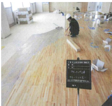
（1.内装木質化の様子）