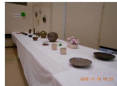
絵画・文集展示の様子