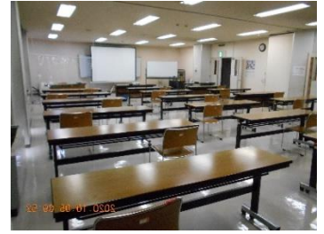
感染防止対策をした会場

大井中央公民館では、来年、建替えなど準備に入るため12月が今度最後の講座となります。出席については体調などを優先し無理のないようにお願いします。