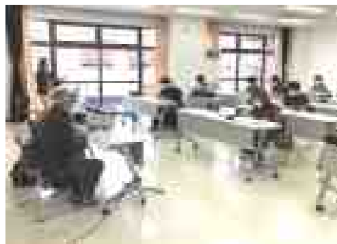
ウクレレ教室の風景